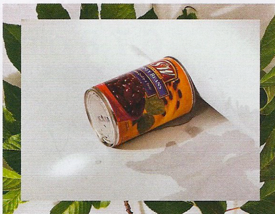
Sol Hashemi, Untitled (Beans) 2012, stampa, cm 25,4x34,3.

aggiunge piccoli inserti a collage. Il mondo raffigurato è uno spazio riempito all'inverosimile. Moscariello dipinge il suo personalissimo archivio di oggetti e di simboli stilizzati. Da scatoloni ammassati uno sull'altro spuntano robot e animali giocattolo, festoni di carta e piante. E il tutto è recintato da un surreale nastro bianco e rosso, che ricorda quello dei lavori stradali. I prezzi variano da 600 euro per le opere di piccole dimensioni (cm 20x30) ai 4mila euro per i lavori più grandi (cm 140x200).