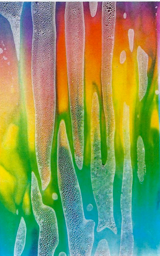
Taisuke Koyama, Senza titolo - Melting rainbows 034 , 2010.